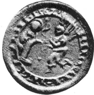
Siegel von 1552