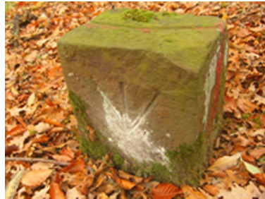
Ergänzung: Grenzstein im Esch- bachwald

Ein Ortssiegel von 1552 (Durchm.: 19 mm) zeigt die Szene Mariä Verkündigung, bezieht sich also auf die Kirchenpatronin. Ein zehn Jahre später geschaffenes und noch 1623 verwendetes Siegel (Durchm.: 31 mm, Umschr.: S · ENINGEN · BÖBLINGER · AMPTS · 1562 ·) enthält gleichfalls die Verkündigungsszene (siehe Abb. oben).